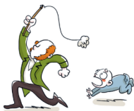
图 像 小 说 人 物 传 记